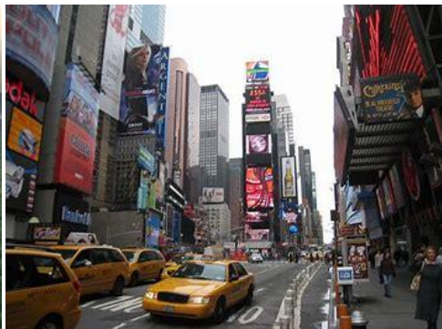
New York (Etats-Unis)