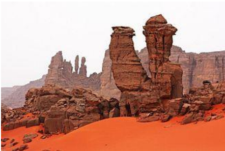
Sahara (sud algérien)

1) Trie ces 6 photos. Pour le faire, remplis l'organigramme qui suit.